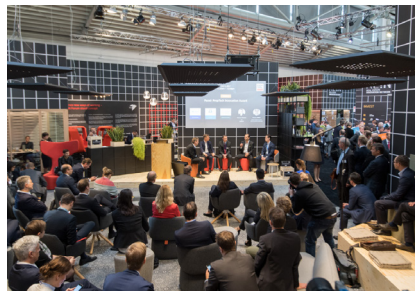
Das neue REIN Forum war ein voller Erfolg.

Weitere Informationen finden Sie auf der EXPO REAL Website: