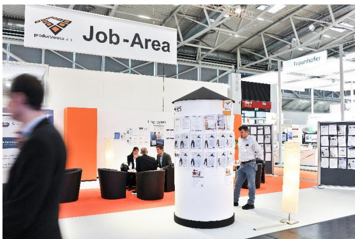
Job-Area – productronica 2013