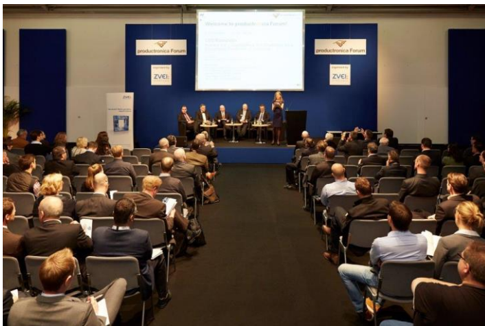
CEO Roundtable – productronica 2013

http://productronica.com/de/home/journalisten/akkreditierung